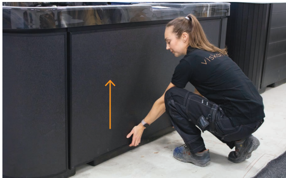
1. Przesu panel do góry, a rowki z tyłu wyjdą z zaczepów, które utrzymują go na miejscu.