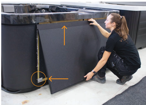
1. Naci nij panel w gór i włó rowki na dolnej kraw dzi panelu w zaczepy znajduj ce si na dolnej kraw dzi ramy wanny.