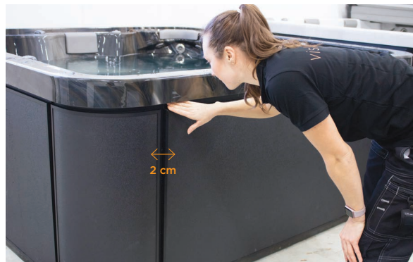
3. Wyreguluj panel w poziomie tak, aby z ka dej jego strony pozostawał odst p ok. 2 cm.