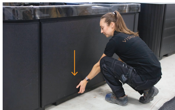
2. Pozwól, by panel opadł na swoje miejsce.