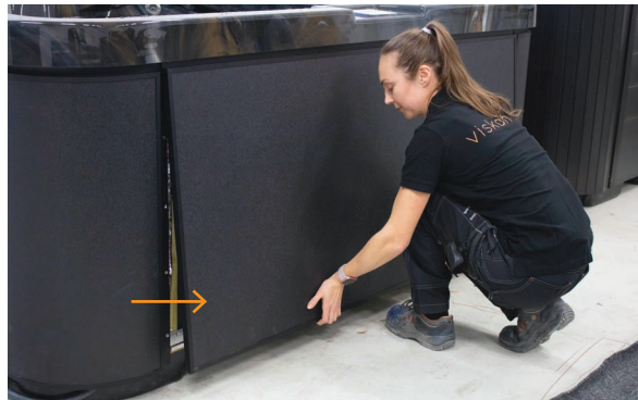
2. Poci gnij panel do siebie i odł cz go od mocowania.